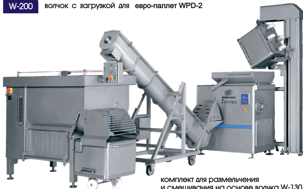
комплект для размельчения и смешивания на основе волчка W-130