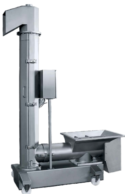
столбовой загрузчик WS-2