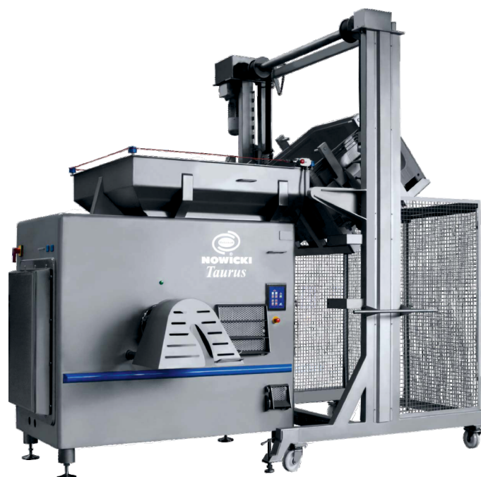
W-200 волчок с загрузкой для евро-паллет WPD-2