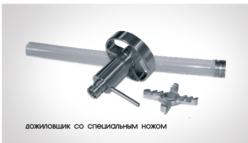
ДОЖИЛОВЩИК СО СПЕЦИАЛЬНЫМ НОЖОМ