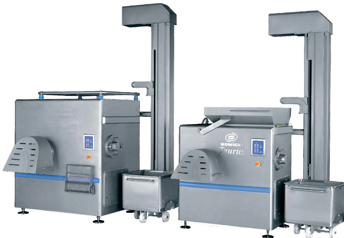
W-160 и W-130 со столбовой загрузкой

Предусмотрены для обработки разных видов фарша: мяса, рыбы, дичи, сыра, овощей и фруктов, приправ и других съедобных продуктов, а также сырых свиных шкурок, свежего и мороженого мяса.