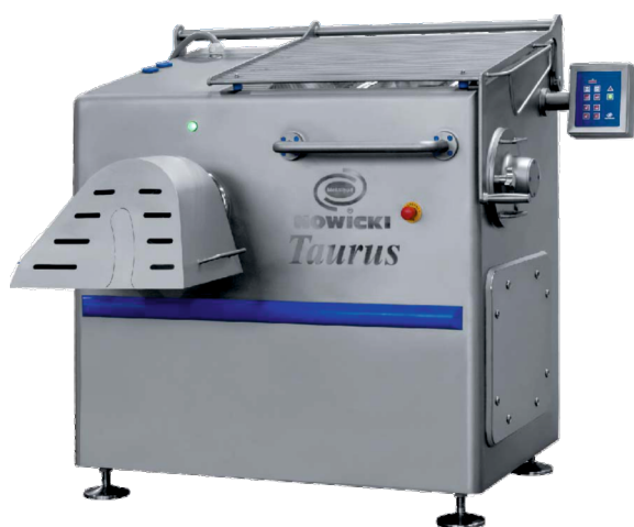
W-130 в версии с ручной загрузкой