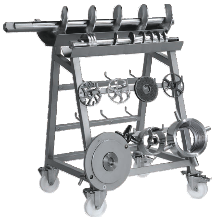
тележка для инструментов