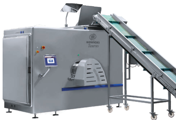
волчок с ленточной загрузкой W-280